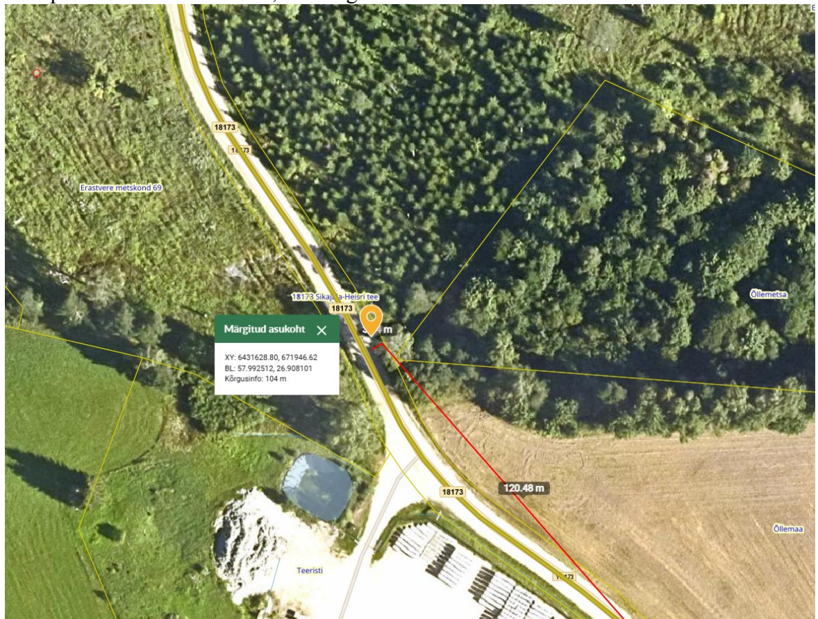
Joonis 1. Ristumiskoha asukoht tähistatud oranži tingmärgiga.